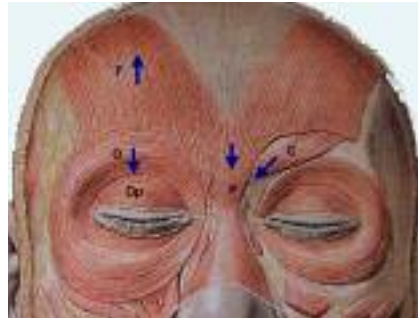
Schéma 2 : Muscles peauciers de la balance musculaire frontale (d'après Sobotta). F : Frontal, P : Procerus, C : Corrugator, O : Orbiculaire (portion orbitaire et palpébrale)

L'injection de toxine botulique se fera dans la partie moyenne du front 2 cm minimum au dessus des sourcils (3 cm dans la partie externe) pour estomper les rides. L'injection de la partie inférieure du muscle frontal, dans les 2 cm sus-jacents au sourcil, estompe certes les rides horizontales inférieures, mais en abaissant les sourcils, ce qui entraîne un effet esthétique négatif («air fatigué de chien battu»). Ainsi, seule une position haute du sourcil peut être une indication à injecter à ce niveau pour descendre le sourcil, ce qui est rare en pratique.