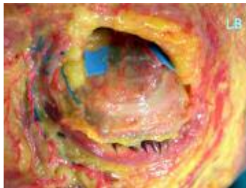
Schéma 5 : Dissection anatomique du releveur de la paupière supérieure.

Son atteinte par la diffusion de produit à partir d'une injection trop basse de la patte d'oie entraînera une gêne de l'expression du sourire et une accentuation du sillon naso-génien (Photo 5).