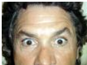
Photo 4 : «Méphisto». Sa correction est aisée avec une nouvelle injection dans les fibres musculaires actives restantes du muscle frontal.