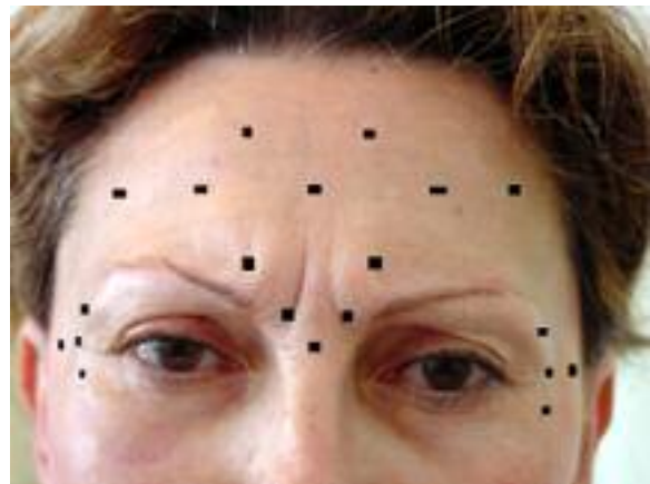
Photo 6 : Schéma d'injection type Vistabel® (visage 1/3 supérieur) extension de l'indication classique de 50 U Vistabel® réparties harmonieusement sur le 1/3 supérieur du visage. Tous les points correspondent à une injection de 2,5 U Vistabel®. La procédure pourra être modifiée selon les cas (intensité des contractions, taille du front...) ; par exemple en augmentant les doses de la glabelle et en diminuant les doses de l'orbiculaire (point latéral).

La répétition des injections de façon régulière prolonge la durée de l'effet cosmétique.