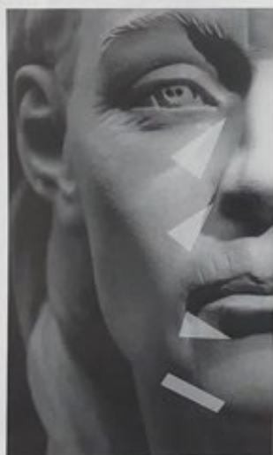
[1] Zones d'ombre

Une injection ciblée de ces zones d'ombre, qui sont des zones de dépression, permet déjà au patient de retrouver un visage plus reposé et des expressions positives.