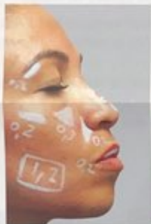
Plan de traitement