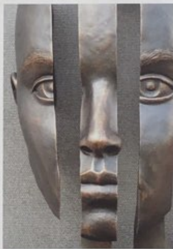
[2] Zones d'ombre regroupées sous les bandes verticales